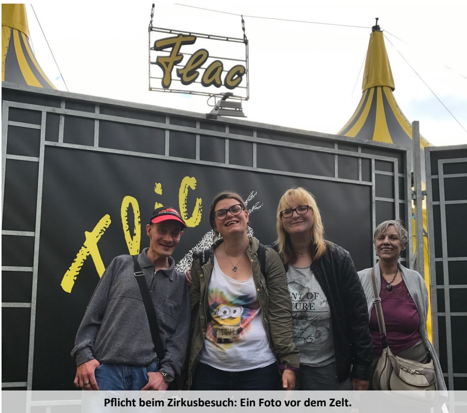
Pflicht beim Zirkusbesuch: Ein Foto vor dem Zelt.

Klienten und Bewohner aus Fliedner-Einrichtungen profitieren von dem Angebot