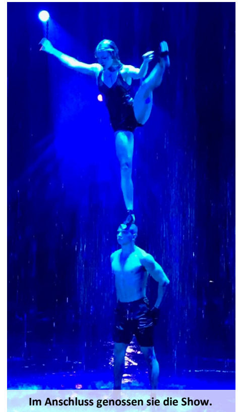
Im Anschluss genossen sie die Show.